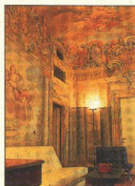
Palazzo Fiorino: Zwischen Geschichte und Moderne