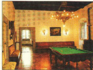
Wohnen in alten Mauern im Castelletto (li.) oder Billard spielen in der Villa Amena (re.)